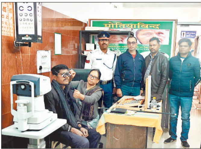
वाहनों चालकों की हुई नेत्र परीक्षण।