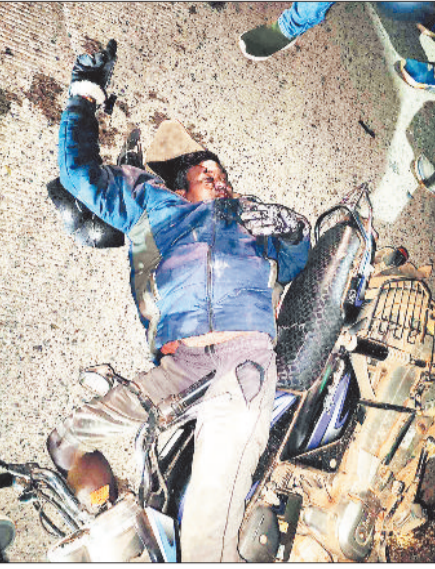
घटना स्थल पर घायल बाइक सवार।

एनएच 43 पर आए दिन दुर्घटनाएं होती रहती है। लुचकी घाट से लेकर कुनकुरी के बीच अब तक कई सड़क हादसा हो चुके हैं जिसमें कई लोगों की मौके पर ही मौत हो चुकी है। इसी तरह एनएच 130 पर हालही में कई सड़क दुर्घटना हुई जिसमें वाहन सवार के साथ पैदल जा रहे लोगों की